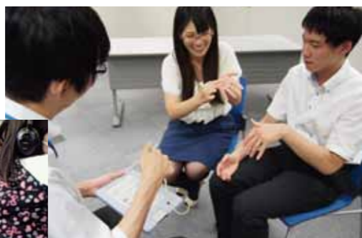
「聞こえない人とコミュニケーションをとろう」の様子