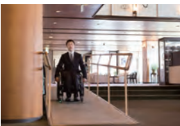
ロビーにはスロープがつけられ、車いすでの移動ができるようになっている。