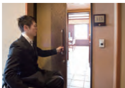
客室の扉は引き戸で、開口も広く、車いすでも入りやすい。入口から部屋の中までフラット。