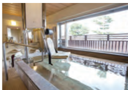
座ったままの状態でご入浴できる補助装置付きの貸切風呂。家族みんなでお風呂を楽しむ。