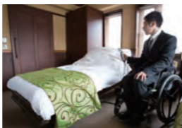
ベッドは角度と高さが自由に変わられ、車いすから体を移したり、またベッドから起きるのに便利。