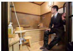
車いすから乗り移ってシャワーを浴びることができる。これにはNTTクラレティ・高橋もびつり。