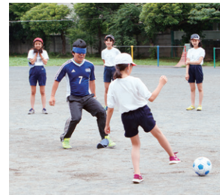
パラスポーツ体験授業

パラスポーツを通じて、障がい当事者と触れ合う機会として、武蔵野近隣の小・中学校を中心にパラスポーツ体験授業を行っており、その講師を務めています。