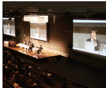
障がい者雇用に関する講演

障がい当事者の立場から障がいへの理解を深めてもらうため、障がい理解研修・心のバリアフリー研修を行っており、聴覚障がいや肢体不自由等の社員と共に講師を務めています。