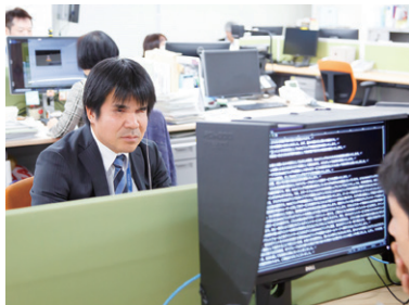
ウェブサイトのアクセシビリティ診断など *UD:ユニバーサルデザイン

ウェブサイトのバリア改善策の提案(アクセシビリティ診断)及び様々な製品・サービスについて障がい当事者目線で改善案のコンサルティングを行うと共に営業活動や進捗管理を行っています。