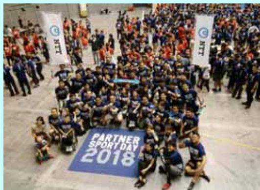
PARTNER SPORT DAY 2018