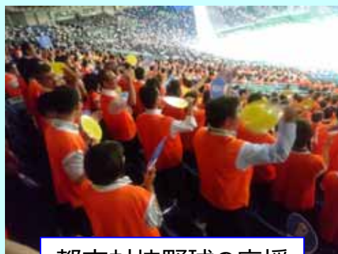
都市対抗野球の応援