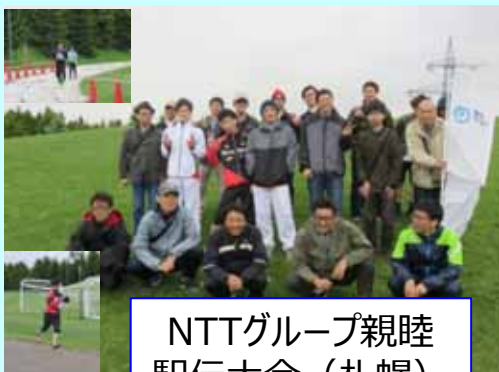
NTTグループ親睦 駅伝大会（札幌）