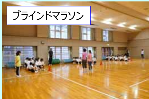
ブラインドマラソン