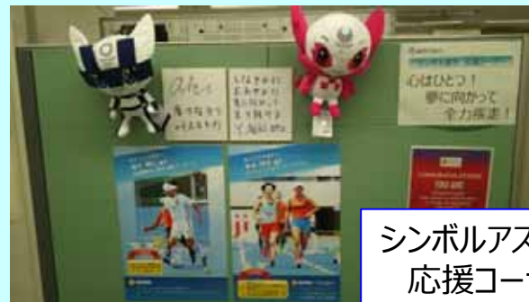
シンボルアスリート 応援コーナー （武蔵野）