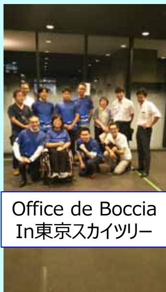
Office de Boccia In東京スカイツリー