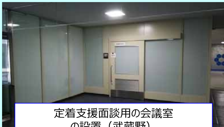
定着支援面談用の会議室 の設置（武蔵野）